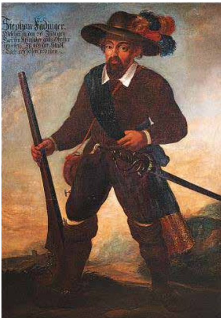
Stefan Fadinger - Landesmuseum Linz, Schlossmuseum

Quellen: bauernkriege.de / evang.at / wikipedia.com / Günter Merz, Jahrbuch für die Geschichte des Protestantismus in Österreich 141/142 (2025/2026) Seite 145 - 156