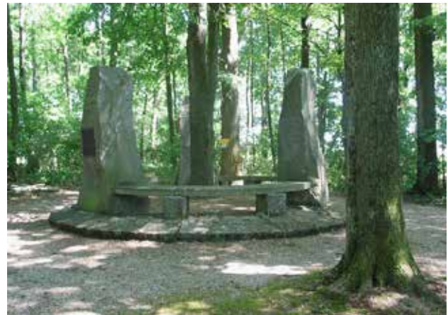
Bauernkriegsdenkmal, Emlinger Holz

Nach verheerenden, blutigen Schlachten im nahen Umland (wie im Emlinger Holz bei Eferding mit rund 3.000 Toten) wurde der Aufstand bis Ende November 1626 endgültig und grausam niedergeschlagen. Wels verlor seinen Status als Rebellenstützpunkt und wurde unter harte kaiserliche und bayerische Verwaltung gestellt.